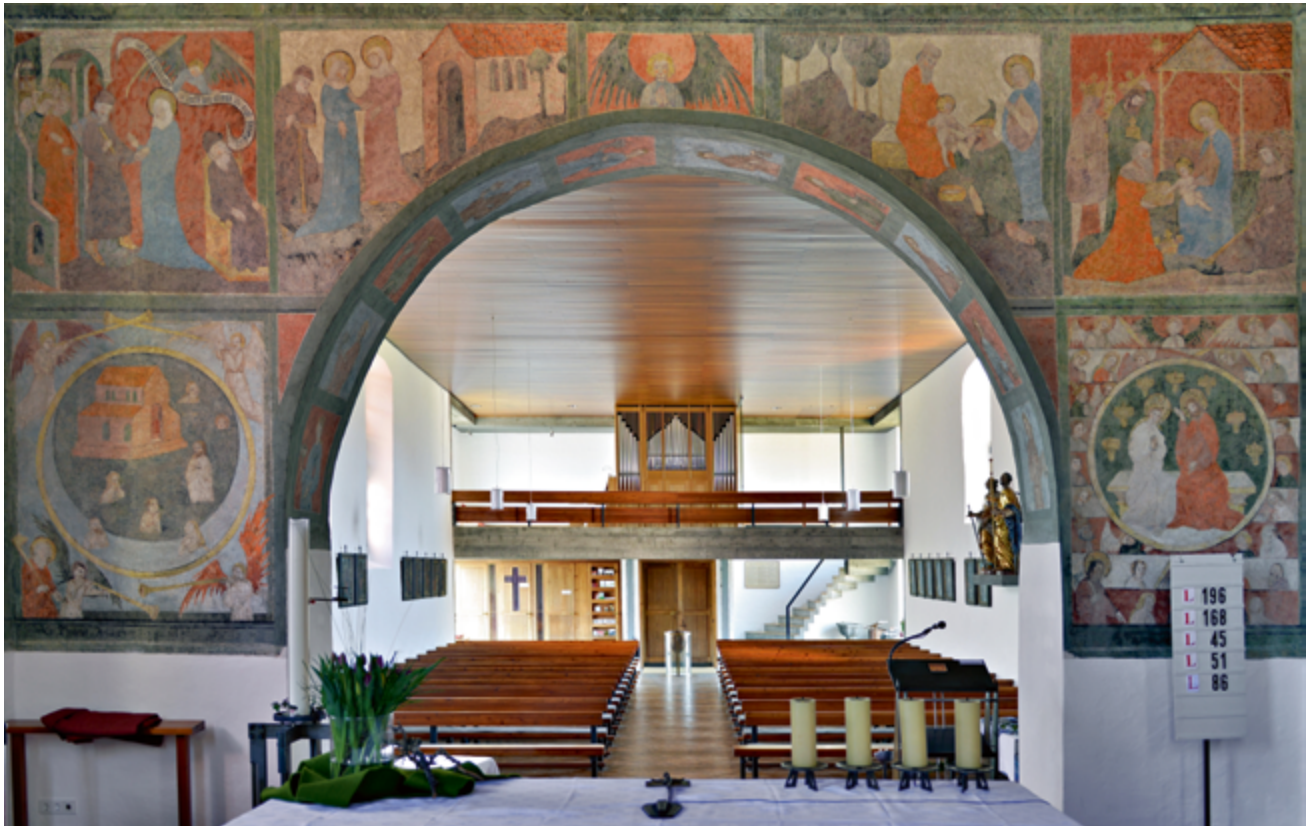
Chorbogenwand vom Chor aus gesehen