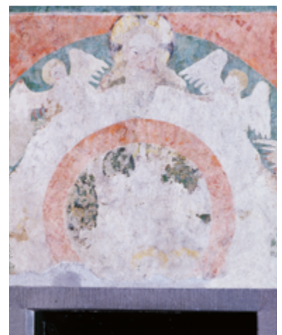
Oben: Zustand nach Freilegung und Übermalung im späten 19. Jahrhundert Mitte: Zustand nach der Endrestaurierung 1950 Unten: Zustand nach der Restaurierung ab 2009