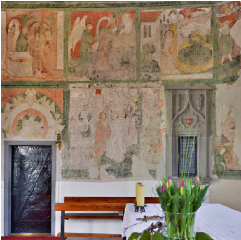
Der Wandmalereizyklus im Chor

Die nach dem Umbau der Pfarrkirche im Jahr 1419 wohl im zweiten Viertel des 15. Jahrhunderts entstandene, malerische Ausstattung der Kirche präsentiert im Chor in zwei Registern oben einen Marienlebenszyklus und unten einen szenisch gestalteten Credo-Zyklus. Die Laibung des Chorbogens besetzen die klugen und die törichten Jungfrauen, die beiden Wandflächen links und rechts des Chorbogens eine Schutzmantelmadonna und mehrere Heiligenszenen wie etwa das Martyrium des hl. Sebastian. Die laufende kunstwissenschaftliche Bearbeitung der Wandmalereien nimmt nicht zuletzt die ungewöhnliche Ikonographie des gemalten Glaubensbekenntnisses in den Blick. In zwölf Szenen werden die Artikel des Apostolischen Glaubensbekenntnisses in bildlicher Form dargestellt. Büsten der zwölf Apostel verweisen auf eine gemalte Inschrift unterhalb der szenischen Darstellungen, die in deutscher Sprache das Apostolische Glaubensbekenntnis zitiert. Der restauratorische Befund lässt freilich vermuten, dass die Inschriften einer späteren Überarbeitungsphase zuzuweisen sind. ➔