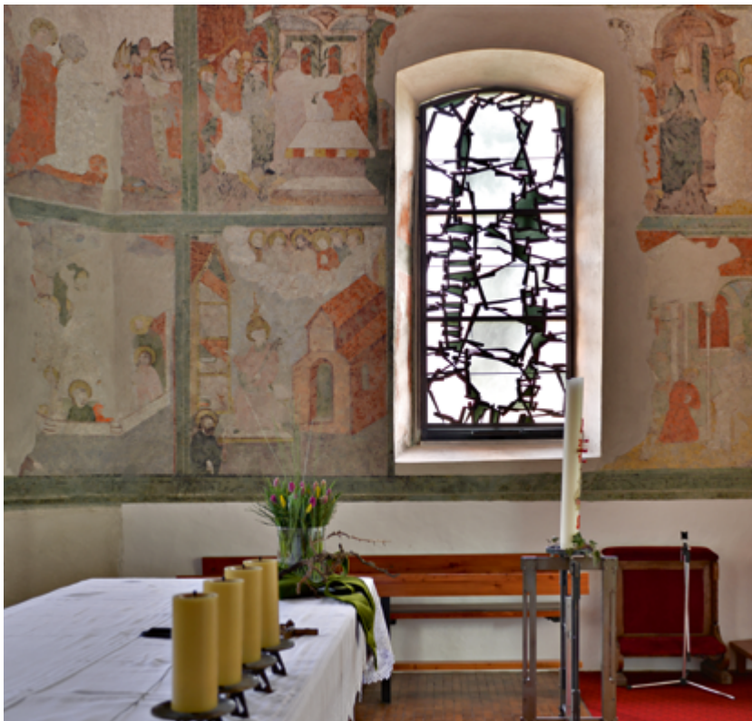
Der Wandmalereizyklus im Chor