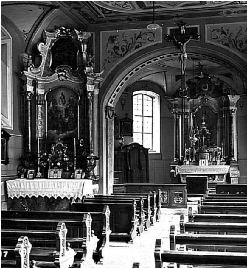
Die barocke Ausstattung der Kirche vor 1960

Drei barocke Altäre nahmen den Platz der mittelalterlichen Altarausstattung ein. Erst in der Mitte des 19. Jahrhunderts ersetzte man die ältere Holzdecke durch eine flache Gipsdecke mit einfacher Gliederung. Ein letzter großer Umbau der Pfarrkirche in den Jahren 1960/62 zielte auf die ›ruhige Klarheit‹ des mittelalterlichen Kirchenraums. Das Langhaus der Kirche wurde aufgrund der stark angewachsenen Kirchengemeinde im Westen um sechs Meter verlängert. Den älteren Bodenbelag tauschte man gegen einen Holzstöckelboden, an die Stelle der Gipsdecken traten wiederum flache Holzdecken. Den freigelegten, mittelalterlichen Aufgang in den Turm integrierte man in den neugestalteten Kirchenraum. Eine schlicht gehaltene Kirchengestaltung und die markanten Betonglasfenster des Düsseldorfer Glaskünstlers Jochem Poensgen prägen die nachkonziliare Erscheinung der Kirche. Für die angestrebte ›mittelalterliche‹ Gestimmtheit des Raumes zentral waren die gegen Ende des 19. Jahrhunderts erstmals freigelegten Wandmalereien des Chorbogens und des Chors der Pfarrkirche. *