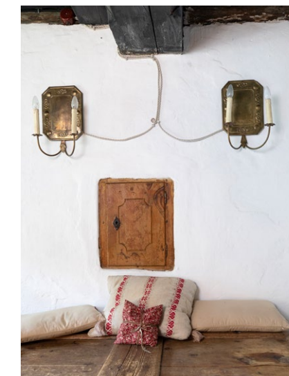
Schnapsschränken in der Stube