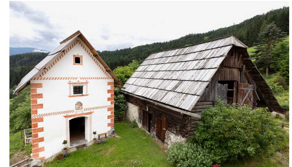
Troadkasten und kleiner Stall