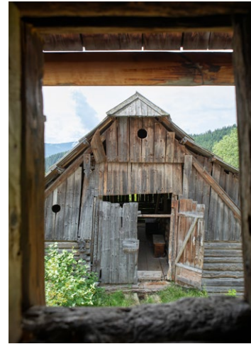
Kleiner Stall, Blick vom Bauernhaus

Dieser Aufgabe stellten sich 2019 neue Eigentümer am Karnerhof in der Lungauer Gemeinde Lessach gemeinsam mit dem Bundesdenkmalamt.