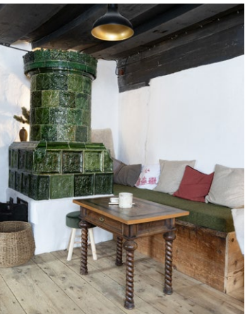
Ofenbank in der Stube

Thermische Verbesserungen wurden auf ein Mindestmaß beschränkt und so ausgeführt, dass die äußere Erscheinung des Bauernhauses unverändert blieb. Im Vordergrund stand die partielle Dämmung der Geschoßdecke über dem Erdgeschoß und der Decken über den Schlafkammern im Dachgeschoß. Im Flur wurde mit Holzdämmplatten und einer Lehmschicht eine Dämmung an der Deckenunterseite hergestellt, sodass sich das Bodenniveau im Dachraum nicht änderte und auf eine schwierige Anpassung bei den Durchgangslichtern der Schlafkammern verzichtet werden konnte.