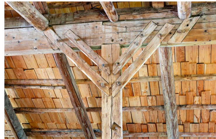
Großer Stall, Dachstuhl detail