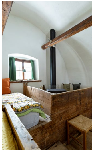
Troadkasten: Alte Mehltruhen als Betten

Im Troadkasten entstand mit ebenso geringen Veränderungen ein zusätzliches Übernachtungsquartier für Tourenger-Gruppen. Das Erdgeschoß wurde als Wohnküche umgestaltet, die traditionellen Mehltruhen im Obergeschoß konnten aufgrund ihrer Größe ohne größere Eingriffe zu Betten umfunktioniert werden.