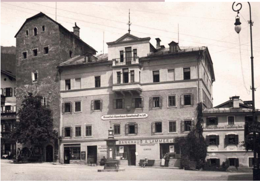
Vogtturm und ehemaliges Propsteigebäude um 1930

Aus dem Gutachten , das im Zusammenhang mit dem geplanten Kauf des Turms durch die erzbischöfliche Hofkammer erstellt wurde, erfahren wir darüber hinaus zur Nutzung, »im alten und hohen Thurn sei ein ansehnlicher und wegen der durchstreichenden Luft sehr nutzbarer Traidt-Cassten zuegericht«. Die Familie des Friedrich Ignaz Lürzer von Zehendtal blieb Grundherr des Turms bis zur Grundentlastung 1848. Über einen längeren Zeitraum war die Familie Kastner Eigentümerin des Objekts, darauf beruht die Bezeichnung Kastnerturm. Der Beginn des Museumsbetriebs 1984 mit Übernahme der heimatkundlichen Sammlungen aus dem Schloss Rosenberg mit einer ständigen Erweiterung des Bestandes mit lokaler und regionaler Geschichte und Kultur als Schwerpunkt stand im Zusammenhang mit dem Erwerb des Turms durch das 1828 gegründete Bankhaus Spängler mit Firmensitz in der Landeshauptstadt Salzburg. ❀