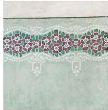
Präsentationsfenster mit floraler Bordüre um 1920

Die Eingriffe erfolgten im Wesentlichen unter Rückführungen von baulichen Veränderungen, die im Zuge des Gesamtumbaus 1984 geschehen sind. Sämtliche Architekturoberflächen wurden je nach vorhandenen Untergründen überwiegend in Kalktechnik aufwändig überarbeitet. Eine Schaufläche mit floraler Ausmalung um 1920 und mehrere Schichtentreppen, die den Zeitgeschmack der Farbauswahl bei Wandfärbelungen dokumentieren, werden gezeigt. Die barocke Stuckdecke mit Hohlkehle im ersten Obergeschoß, die historischen Türstöcke im zweiten Obergeschoß, historische Holzdielenböden und Stiegenläufe wurden fachgerecht restauriert. Im Veranstaltungssaal des vierten Obergeschoßes wurde die bestehende rezente Holzverkleidung abgetragen und die darunterliegende historische Holzdecke wieder freigelegt.