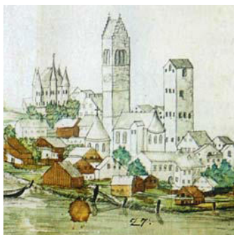
Zell am See mit dem Vogtturm im Jahr 1789, Detail aus der Urkundensammlung von Bürgermeister Salzmann

Der Ursprung des Vogtturms liegt im Dunkeln. Archäologische Grabungen und eine bauhistorische Untersuchung könnten zu dieser Fragestellung Wesentliches beitragen. Der in der Stadtmitte von Zell am See gelegene fünfstöckige Turm wird in den Urbaren als Fuscher- oder Thurnhaus bezeichnet. Eine Urkunde, in der 1254 Erzbischof Philipp von Spannheim dem Pinzgauer Geschlecht der Walcher den unerlaubten Bau eines Turms auf Kirchengrund und die Aneignung von Vogteirechten vorwirft, lässt sich nicht eindeutig mit dem Vogtturm in Zusammenhang bringen. Erst im 15. Jahrhundert finden sich indirekte Hinweise auf die Besitzverhältnisse des Vogtturms . Die Herren von Goldegg standen seit 1369 unter der Lehensherrschaft derer von Hundt als Besitzer des Pinzgauer Schlosses Dorfheim, in dessen Urbarverzeichnis der Turm in Zell am See angeführt wird. 1644 erhalten wir den ersten Hinweis auf die Verwendung des Objekts als Gerichtsdienernerwohnung und Gefängnis.