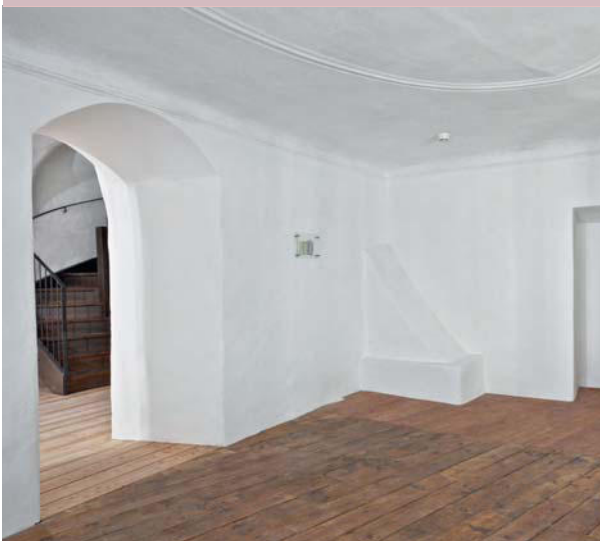
Barocke Stuckdecke in der Wohnstube des 1. OG