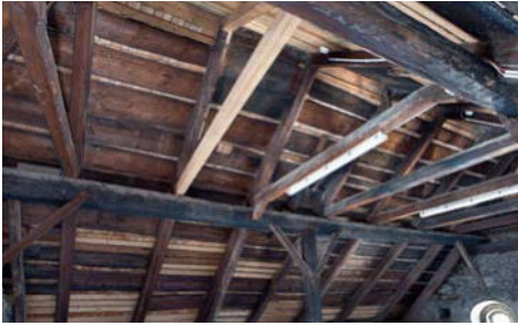
Blick in den Dachstuhl