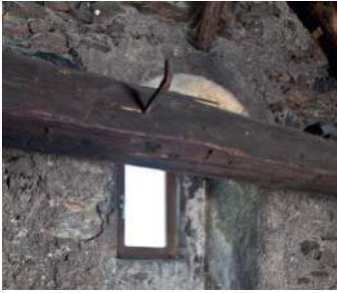
Historischer Holztram vor Mauerwerksnische im Dachgeschoß