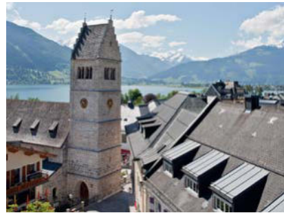
Stadtpfarrkirche hl. Hippolyth mit Zeller See und Blick in die Hohen Tauern

würden. Eine Tauschurkunde aus dem Jahr 926 gibt Zell am See bereits namentlich wieder: Actum in Pisontia in loco Cella n(ominatio). Während die ältere Forschung dieses Bisontium, das auch ›Pinzco‹ genannt wurde, mit Piesendorf gleichgesetzt hat, wird überwiegend seit 1916 Bisontio mit Zell am See als Ursprung des Ortes in Verbindung gebracht.