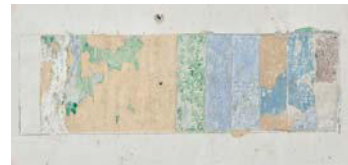
Schichtentreppe mit Dokumentation historischer Wandfassungen

Die Eingriffe erfolgten im Wesentlichen unter Rückführungen von baulichen Veränderungen, die im Zuge des Gesamtumbaus 1984 geschehen sind. Sämtliche Architekturoberflächen wurden je nach vorhandenen Untergründen überwiegend in Kalktechnik aufwändig überarbeitet. Eine Schaufläche mit floraler Ausmalung um 1920 und mehrere Schichtentreppen, die den Zeitgeschmack der Farbauswahl bei Wandfärbelungen dokumentieren, werden gezeigt. Die barocke Stuckdecke mit Hohlkehle im ersten Obergeschoß, die historischen Türstöcke im zweiten Obergeschoß, historische Holzdielenböden und Stiegenläufe wurden fachgerecht restauriert. Im Veranstaltungssaal des vierten Obergeschoßes wurde die bestehende rezente Holzverkleidung abgetragen und die darunterliegende historische Holzdecke wieder freigelegt.