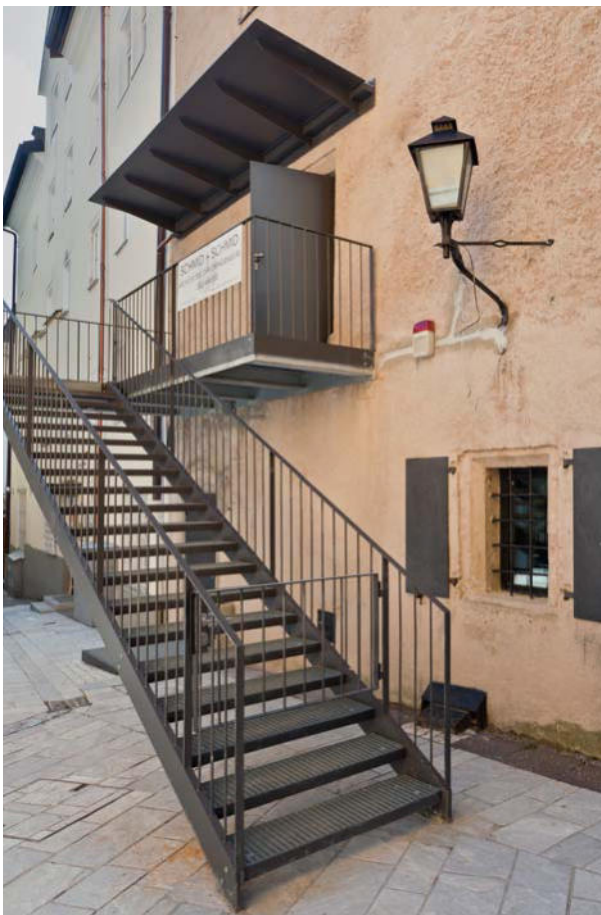
Moderne Außentreppe als Museumszugang

Im Zusammenhang mit der geplanten Reaktivierung des stillgelegten Heimatmuseums Vogtturm stand die Adaptierung des Denkmals 2018 bis 2020 in enger Abstimmung mit der Bauherrschaft. Im Hinblick auf die Nutzungserfordernisse wurde eine Außentreppe aus Stahl unter Verwendung der bestehenden Eisentüre als Museumszugang errichtet und zusätzlich erfolgte die Anbindung an das benachbarte ehemalige Neue Propsteigebäude, heute Bankhaus Spängler, für die Schaffung eines Ausstellungsrundganges.