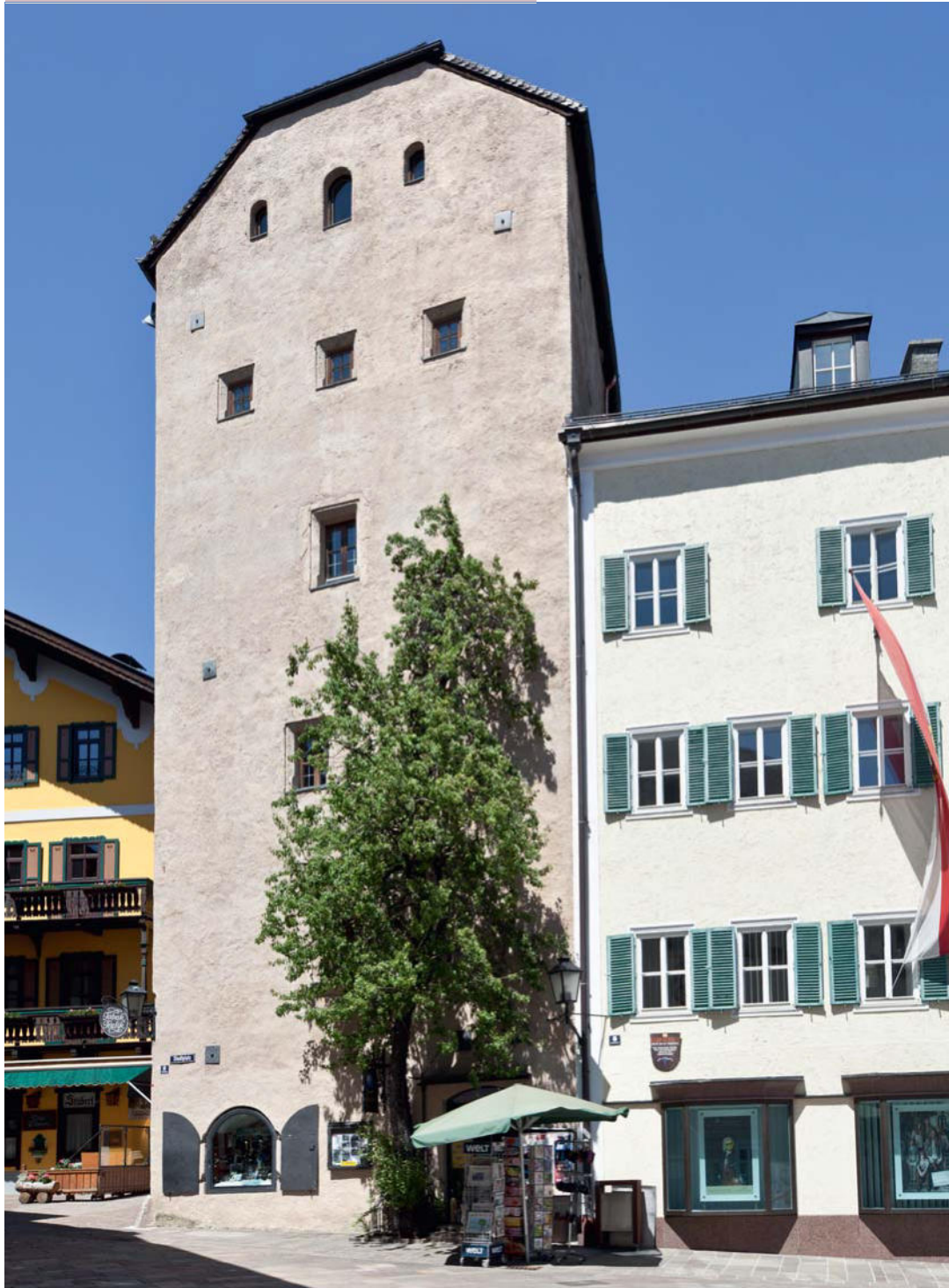
Vogturm mit ehem. »Neuem Propsteigebäude«