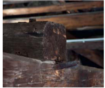
Detailausbildung der Dachstuhlkonstruktion