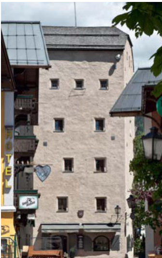
Vogtturm im engen Zeller Stadtgefüge